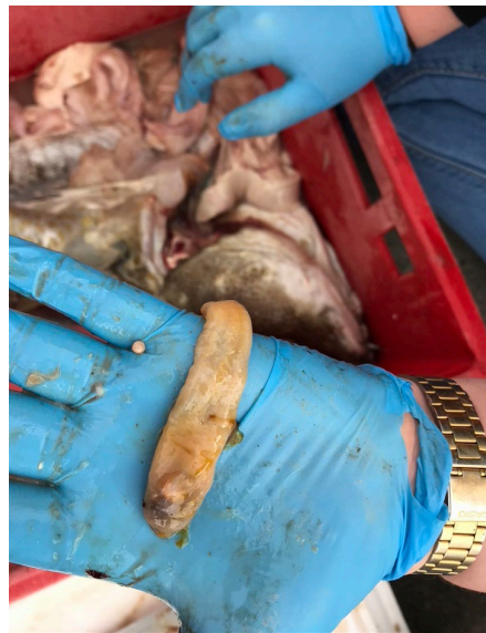
Loðna sem fannst í þorskmaga