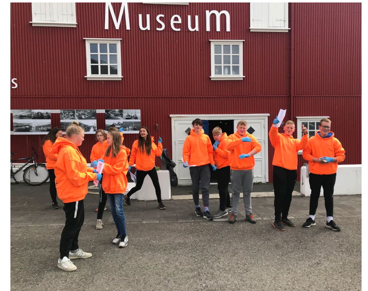
Sjávarútvegsskóli unga fólksins